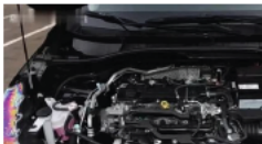
丰田终于拿出诚意，标 2.0L油耗6L，与CRV同