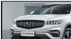
今日官降！ 沃尔沃级 压CRV，仅售9万多，还