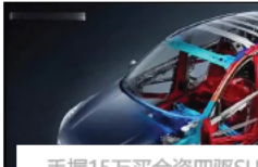
手握15万买合资四驱SU 标配2.0T+8AT，还要啥