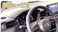
定位低于CR-V，2023本 将登场，配1.5T燃油和2